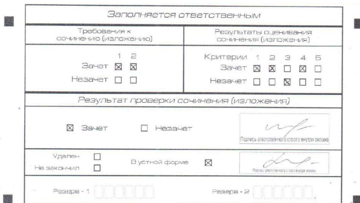
Рис. 9. Область для оценки работы сочинения (изложения) в устной форме

После окончания заполнения бланка регистрации ответственное лицо ставит свою подпись в специально отведенном для этого поле.